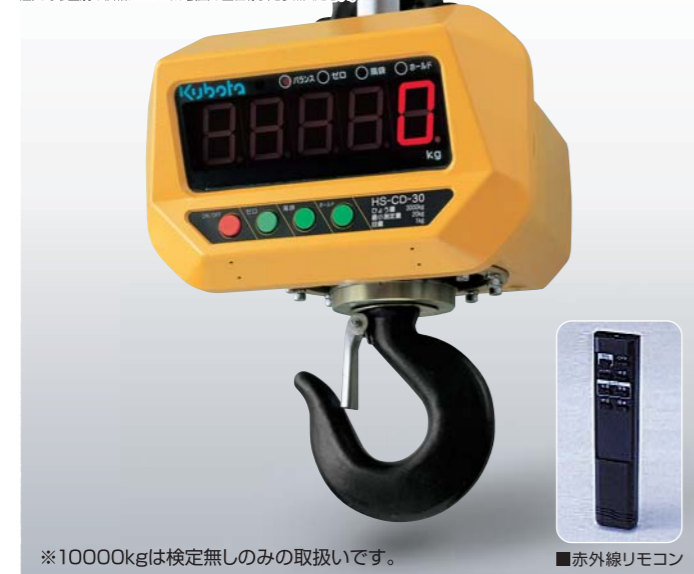
*10000kgは検定無しのみ取り扱いです。