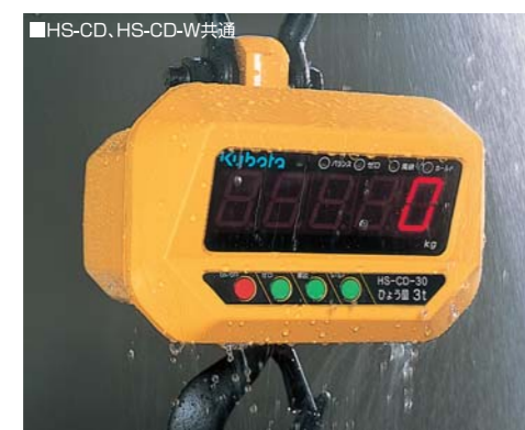
フレームには丈夫で壊れにくいアルミ鋳物を使用。IP65の実現で、防水・防塵性を求められる環境に適します。