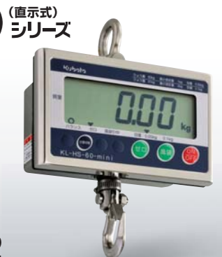
*KL-HS-mini(-K)シリーズのフックは回転しません。