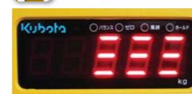
電源オン時やリモコンによるバッテリーチェック時に、バッテリー残量をパーで表示。使用可能時間の把握に便利です。