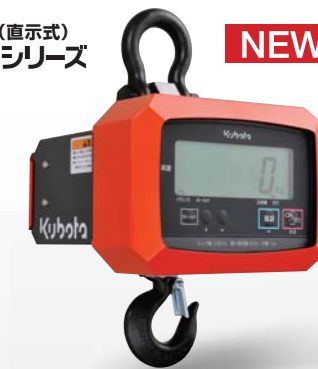
*KL-HS-Q(-K)シリーズのフックは回転しません。

大きなボタン配置でシンプルな構造です。表示部は最大20°調整でき、見やすい角度にできます。またIPX3相当で小雨でも屋外で計量作業が可能です。*使用後は充分に乾燥させてください。