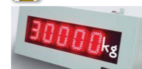
さらに大きな質量表示が可能なオプションもご準備。有人クレーンのオペレータ操作時等に便利です。